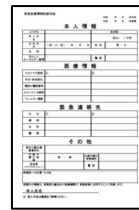
救急医療情報記録用紙

（2枚を重ね、救急医療情報キットのご案内を上にして山折り線で折り、完成イメージ図のように「救急医療情報キット」の文字が見えるよう、丸めて入れます）