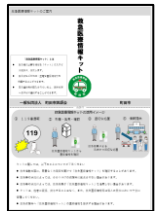
救急医療情報キットのご案内