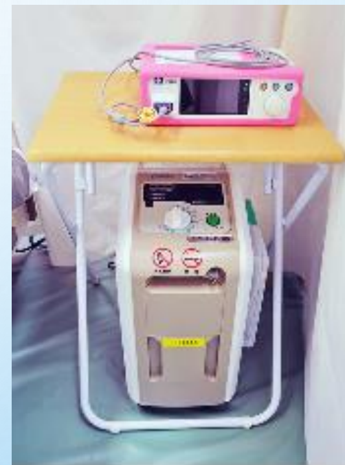
サチュレーションモニターと酸素濃縮器