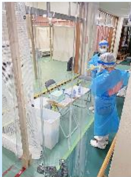
レッドゾーン内での患者対応の準備